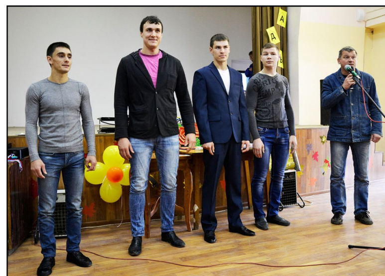
На фото: Представители Школы САМБО имени Л.Д.Голева