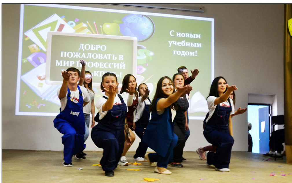
На фото: ребята из танцевальной группы «Флэш-моберы»