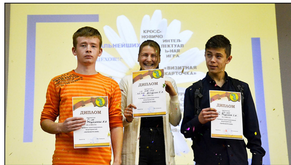
На фото: Лучшие первокурсники КМ-115, Г-11, СП-111 с дипломами 1, 2, и 3-ей степени.