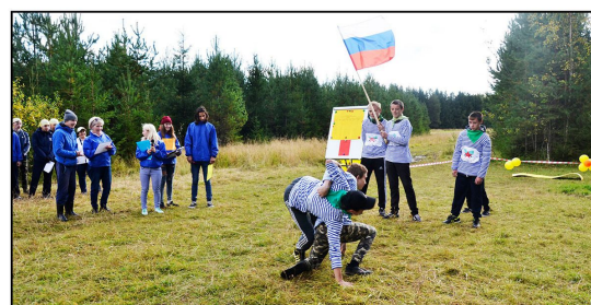
На фото: Приветствие студентов-первокурсников из группы Ш-16