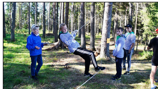
На фото: Туристическая полоса препятствий