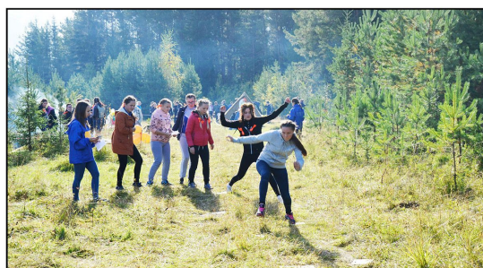
На фото: Девочки-первокурсницы на туристической полосе препятствий