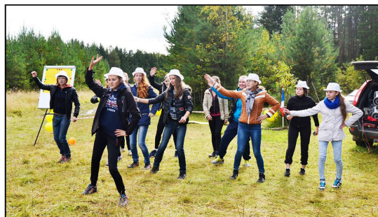
На фото: Представление команды