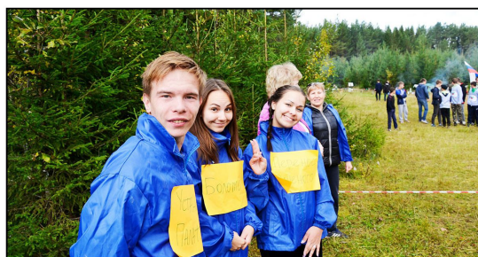
На фото: Волонтеры-второкурсники