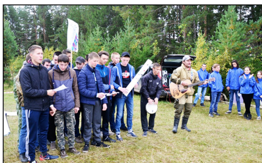
На фото: Приветствие команды

Студентов-первокурсников Коми-Пермяцкого политехнического техникума 15 сентября в целях популяризации спортивного туризма и активного отдыха, повышения уровня физической культуры студентов собрали на туристический экослет на территории трамплина.