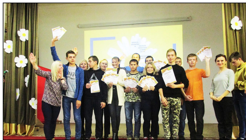
На фото: На сцене представители всех групп первокурсников - 2017 со своими дипломами и сертификатами и преподаватели Коми-Пермяцкого политехнического техникума