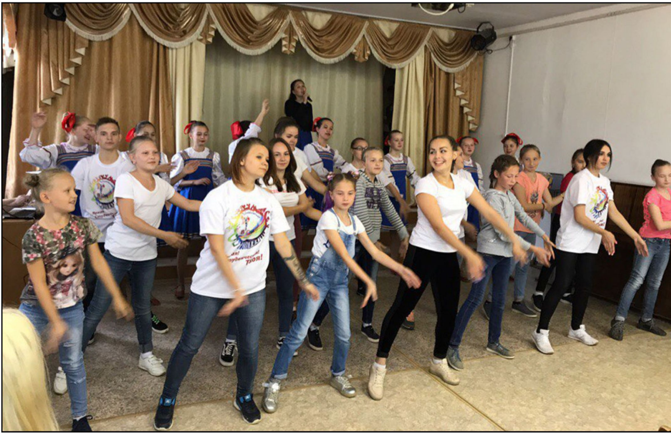
На фото: Творческое объединение политехнического техникума «Флэш-моберы» представили попури современных танцевальных направлений.

Творческое объединение политехнического техникума «Флэш-моберы» представили попури современных танцевальных направлений под зажигательные хиты всех времен и народов. Ну, а завершилась программа душевной музыкальной композицией в исполнении Кудымкарского педагогического колледжа «Ветер перемен».