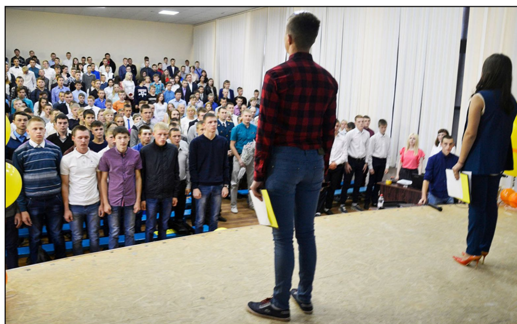
На фото: Первокурсники-2017

1 сентября Коми-Пермский политехнический техникум открыл новую страницу в предстоящей образовательной деятельности.