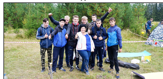
На фото: Группы СМ-14, С-19 готовятся к разбивке лагеря