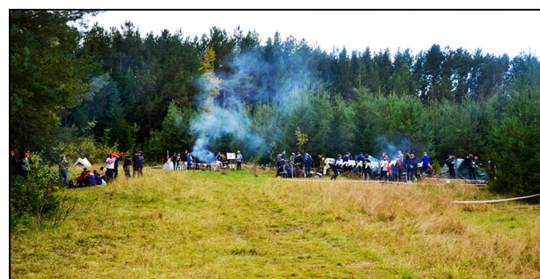
На фото: Разбивка лагерей