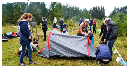
На фото: Разбивка лагеря