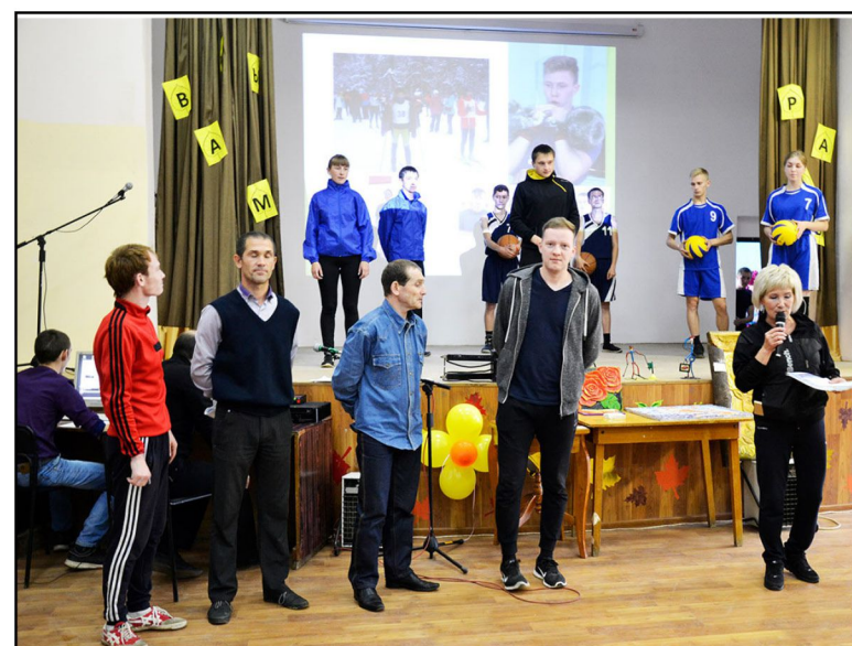
На фото: Презентация спортивных секций