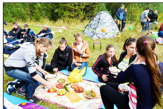
На фото: Готовка походной кухни