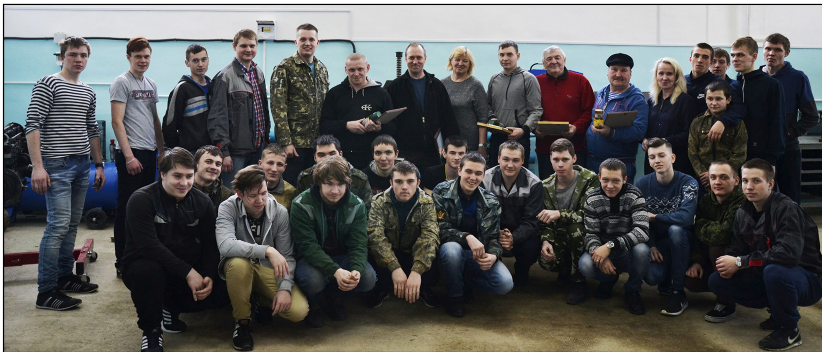
На фото: Команда автомехаников и их родители.