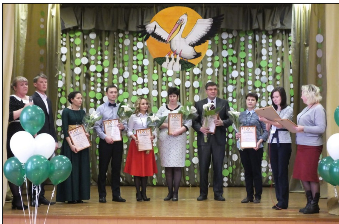
На фото: Награждение победителя, призеров и участников конкурса учитель года- 2018 на базе агротехнического техникума.

Конкурс направлен на развитие творческой деятельности преподавателей и их професси-