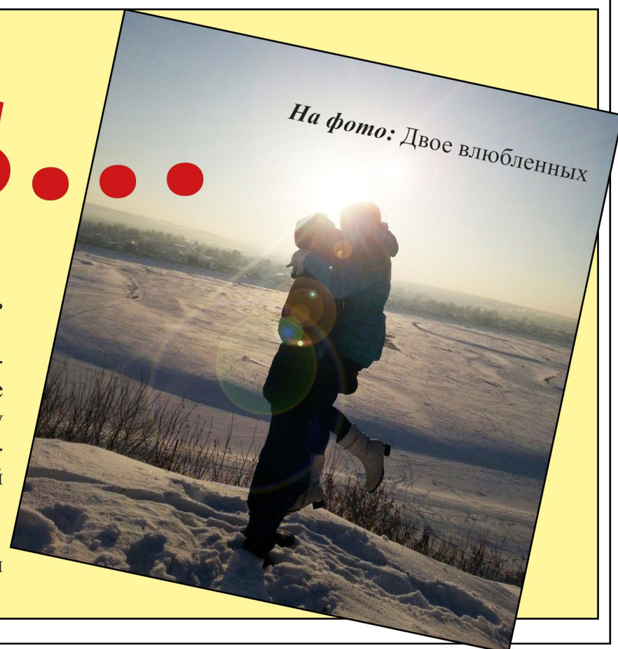
На фото: Двое влюбленных