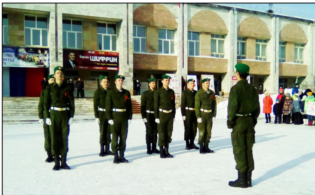
На фото: обучающиеся Коми-Пермяцкого политехнического техникума

Городское мероприятие «Кудымкарский танковик - 2018» было посвящено не только Дню Защитника Отечества, а также 100-летию Красной Армии, 80-летию города Кудым-