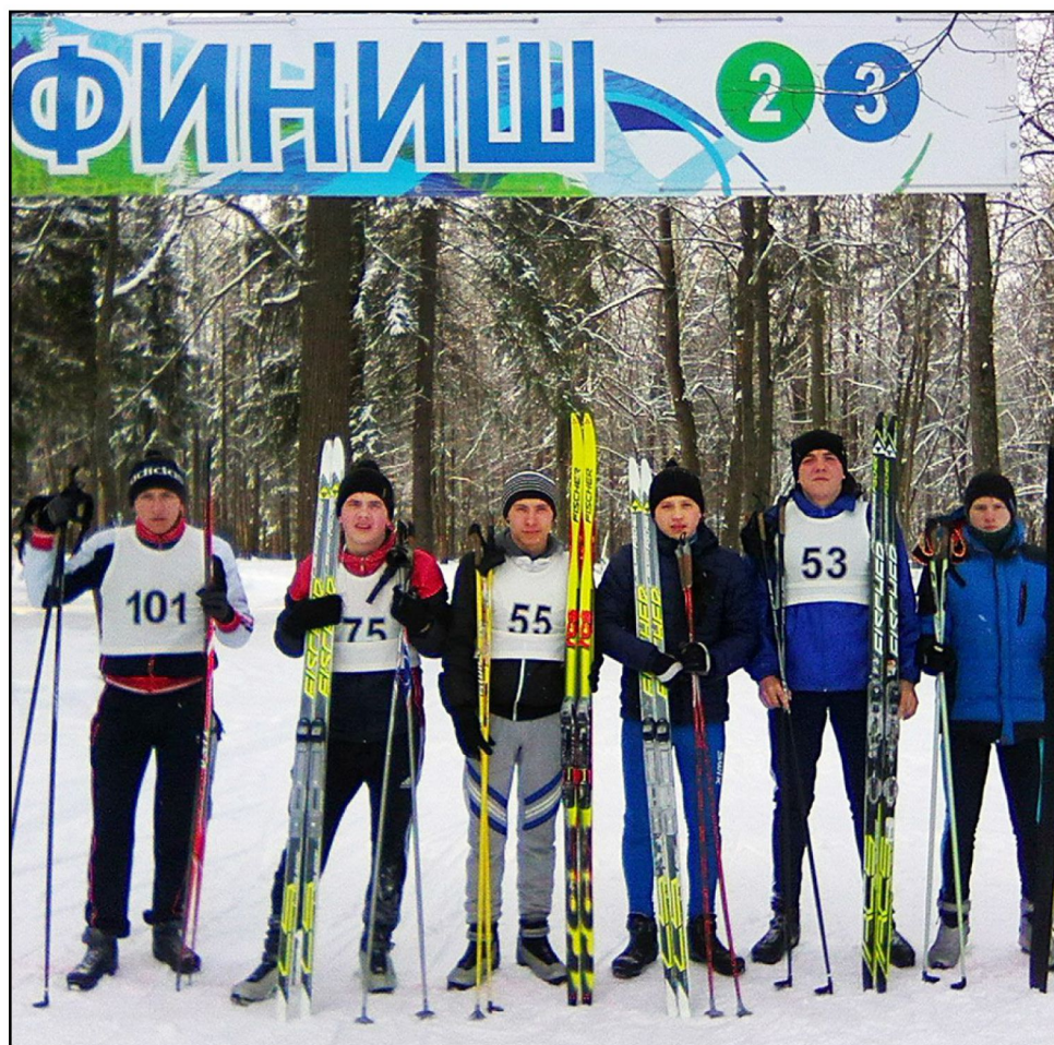
На фото: Команда Политеха на финише соревнований по полиатлону

20-21 февраля 2018 года в Перми прошли соревнования по полиатлону среди образовательных учреждений Пермского края. Из 13 команд края команда Коми-Пермяцкого политехнического техникума стала «бронзовым» призером соревнований.