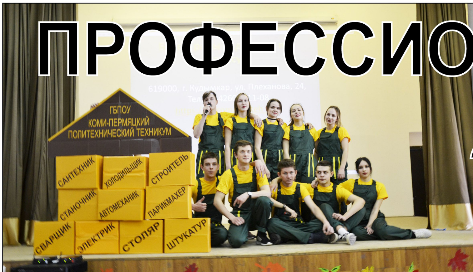
На фото: Открытие декады «Я профессионал 2018»

В Коми-Пермяцком политехническом техникуме стартовала Декада профессионального мастерства «Я – профессионал 2018».