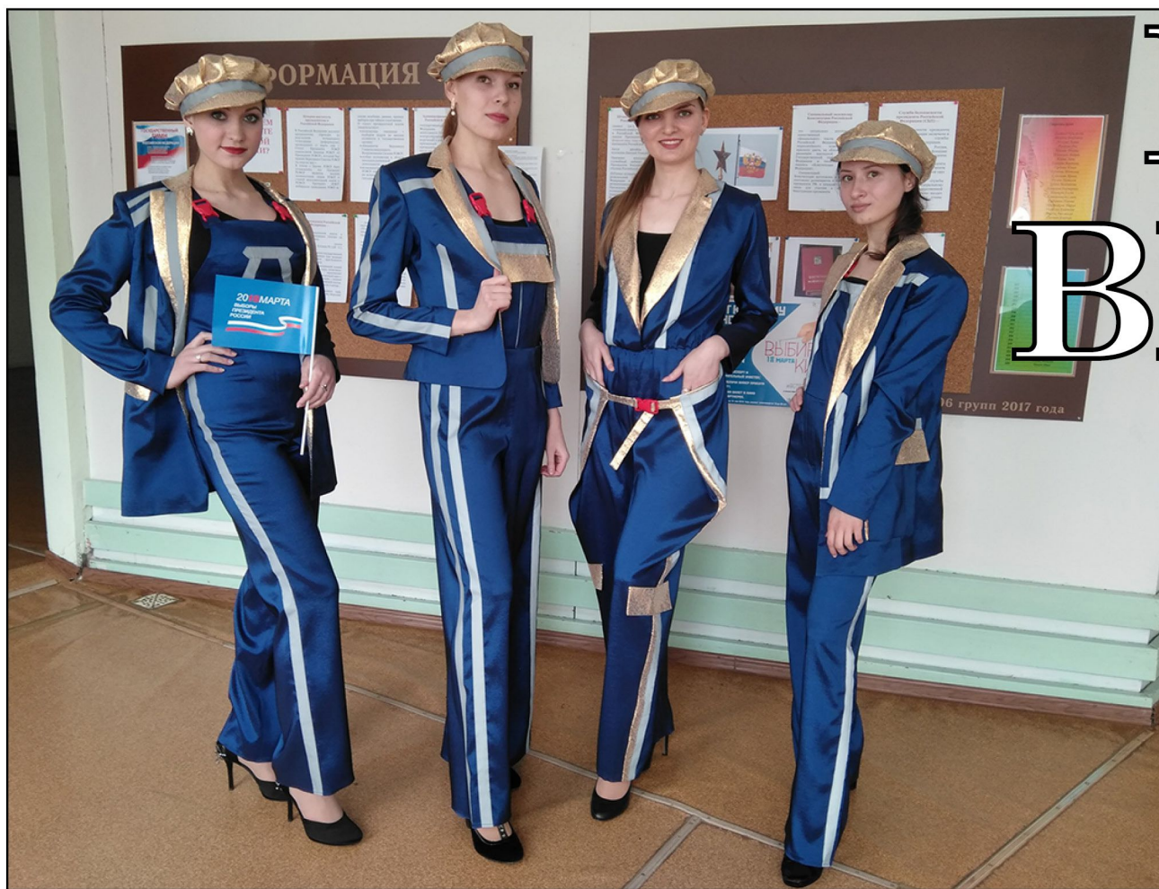
На фото: Театр моды «Колорит»