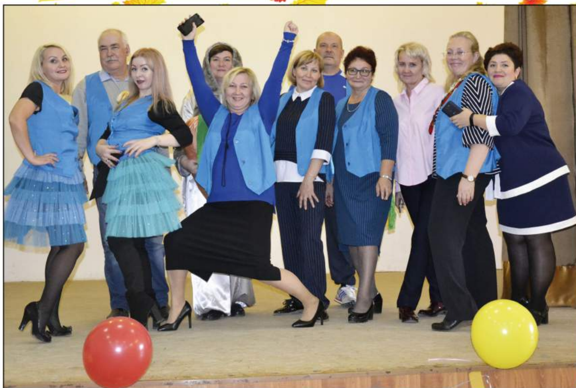
На фото: Самые позитивные, смелые, энергичные педагоги Коми-Пермяцкого политехнического техникума на игре КВН против студентов

В день осенний, когда у порога Задыхали уже холода, Техникум празднует День педагога- Праздник мудрости, знаний, труда.