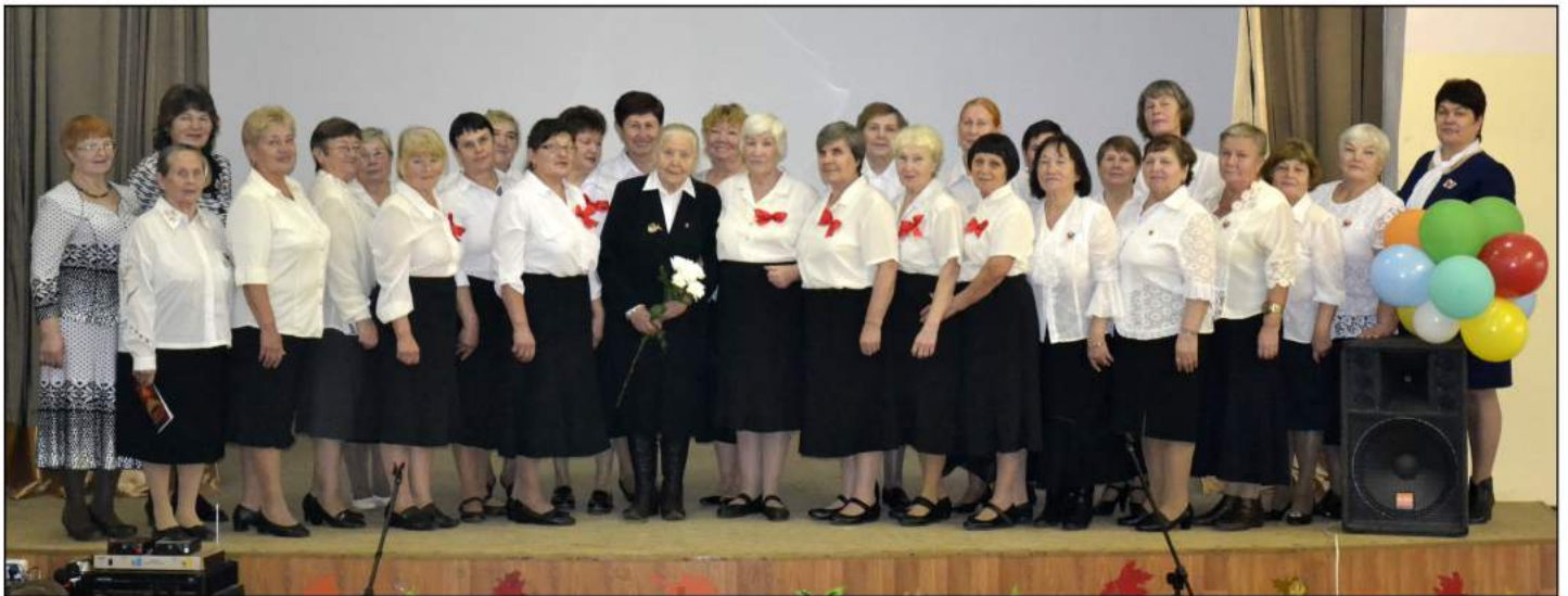
На фото: Ветеранские коллективы города Кудымкара

Напомним, 100-летие ВЛКСМ (Всесоюзный Ленинский коммунистический союз молодежи) будет отмечаться 29 октября. ВЛКСМ уже давно прекратил свое существование, но для многих россиян День рождения комсомола по-прежнему остается одним из