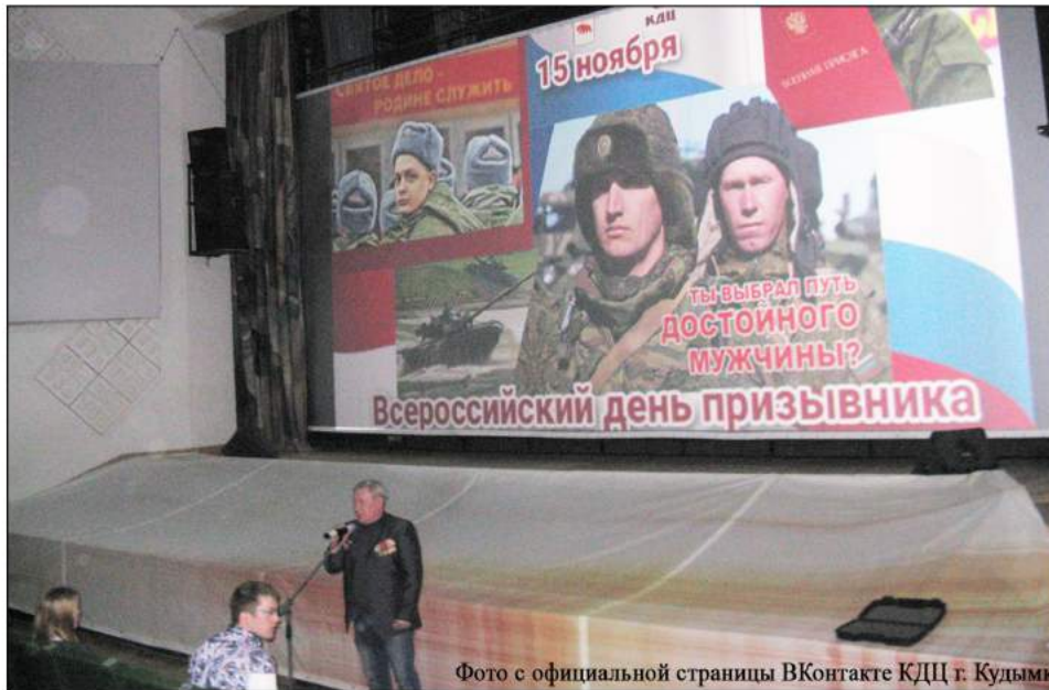
На фото: Празднование Дня призывника в КДЦ г. Кудымкара

15 ноября в КДЦ г. Кудымкара состоялся День призывника 2018.