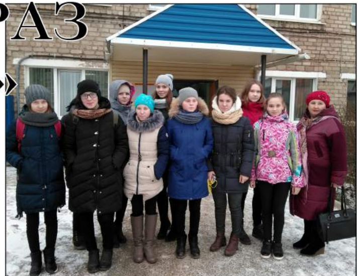
На фото: Выпускники Пешнигортской средней образовательной школы

В Коми-Пермяцком политехническом техникуме школьники могут сделать выбор из более 10 профессий и специальностей. Техникум успешно осуществляет набор студентов на 1 курс обучения. Многие выпускники Коми-Пермяцкого политехнического техникума добились больших профессиональных успехов, состоялись как личности, работающие на