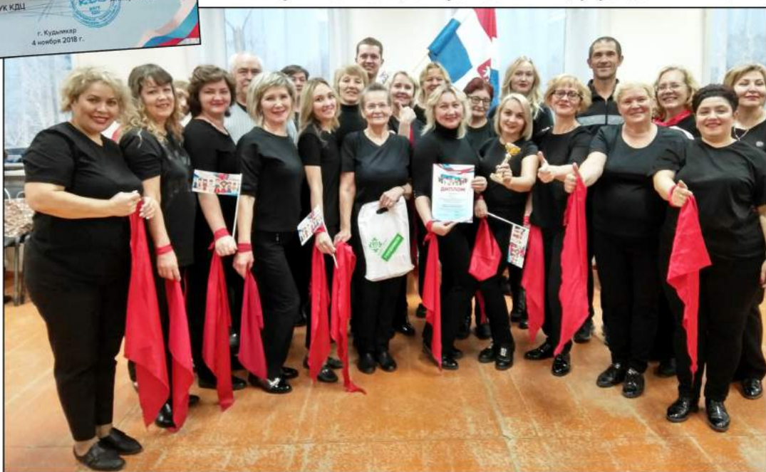
На фото: Педагогический состав КППТ

Трудовые коллективы города Кудымкара исполнили самые яркие и патриотические номера. Коллектив