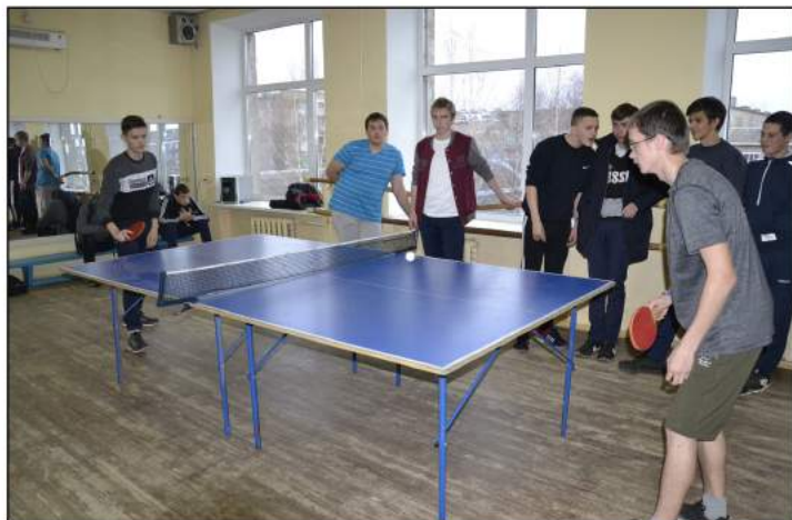
На фото: Личные встречи участников турнира

7 ноября в Коми-Пермяцком политехническом техникуме прошел Открытый Кубок по настольному теннису.