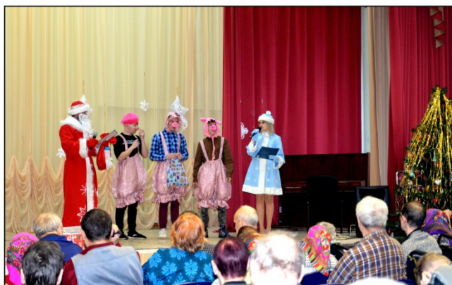
На фото: на сцене обучающиеся КПИТ