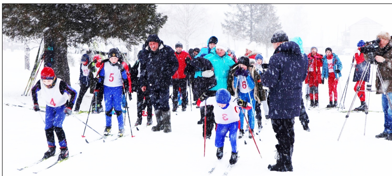
На фото: Участники забега на старте

31 января прошли открытые соревнования ДЮСШ г. Кудымкара по лыжным гонкам в память о спортсменах-лыжниках г. Кудымкара.