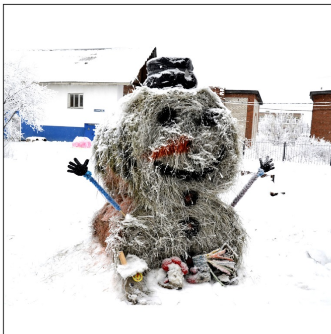
На фото: Лымбаба группы Э-12