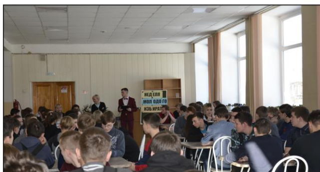
На фото: 13 команд политеха на игре «Что? Где? Когда?»