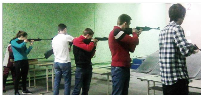
На фото: Участники зимнего полиатлона в г. Перми

26 февраля на лыжном комплексе МАУ ДО «ДЭСШ» г. Кудымкара прошло Первенство по лыжным гонкам