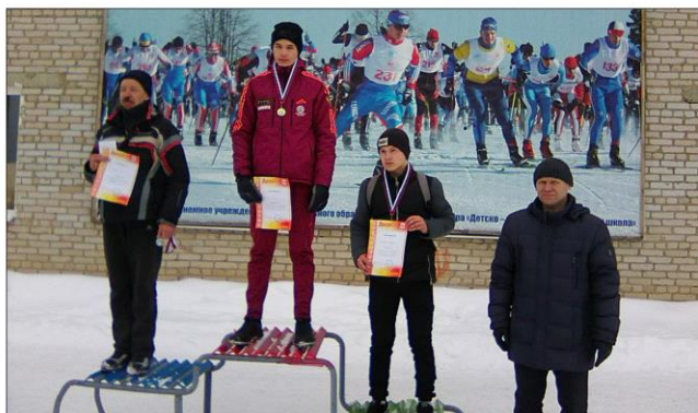
На фото: Первенство по лыжным гонкам