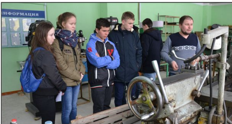
На фото: Мастерская станочников