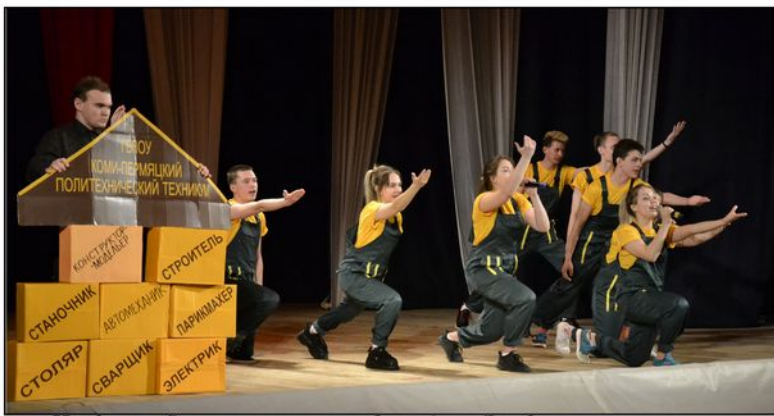
На фото: Выступление агитбригады «Явыбираю политех»