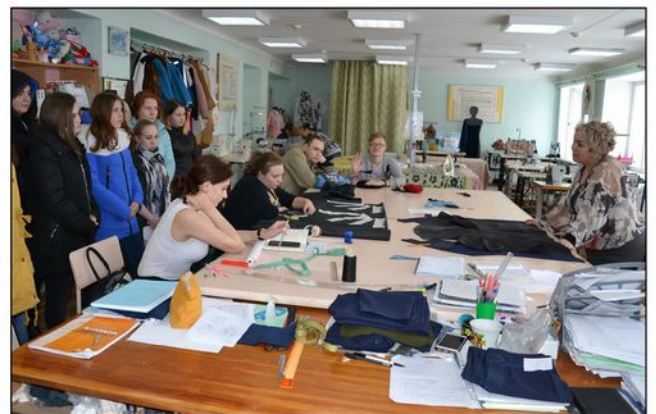
На фото: Мастерская технологов-конструкторов