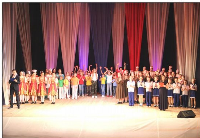
На фото: На сцене все коллективы и участники Кейса