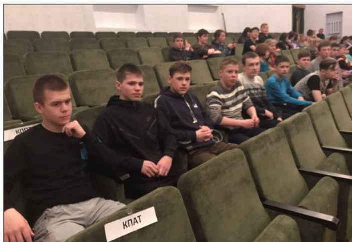
На фото: Группа сварщиков пришла на концерт в числе первых