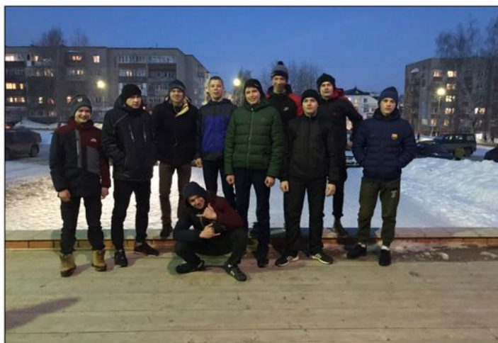
На фото: Обучающиеся группы Г-11