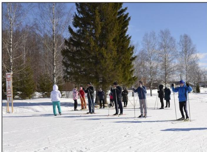
На фото: На старте мужской состав КППТ