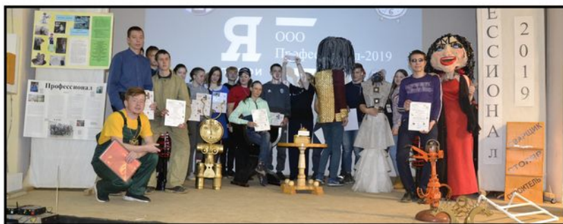
На фото: Награждение лучших Декады - 2019