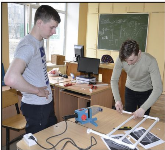
На фото: Лайфхак от монтажников