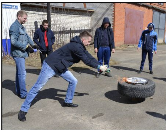
На фото: Лайфхак от автомехаников