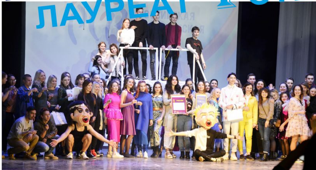
На фото: Команда КППТ на Фестивале в Перми

10 апреля, в среду, на Большой сцене Культурно-Делового Центра состоялся Гала-концерт фестиваля «Студенческая весна» среди учебных заведений среднего профессионального образования г. Кудымкара.