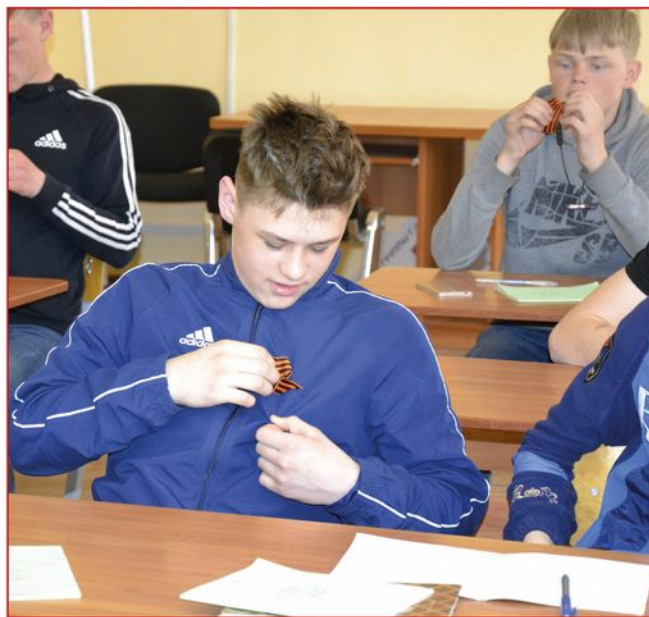
На фото: Обучающиеся группы Г-11