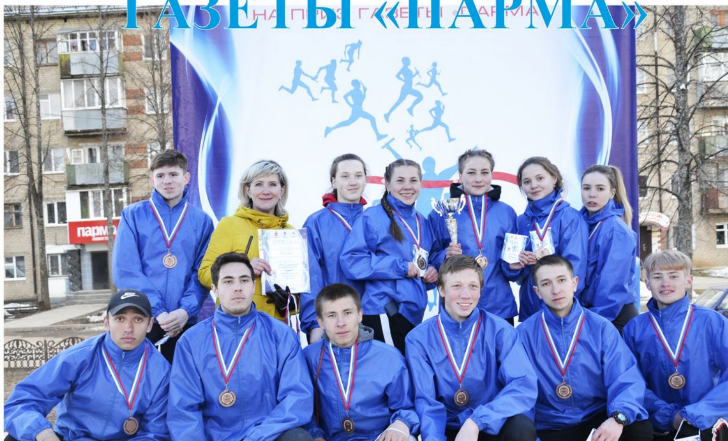
На фото: Участники бронзового забега

25 апреля, в Кудымкаре прошла 80-я окружная открытая легкоатлетическая эстафета на приз газеты «Парма», посвященная 440-летию поселения г. Кудымкар.