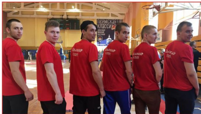
На фото на переднем плане: Команда КППТ по гиревому спорту