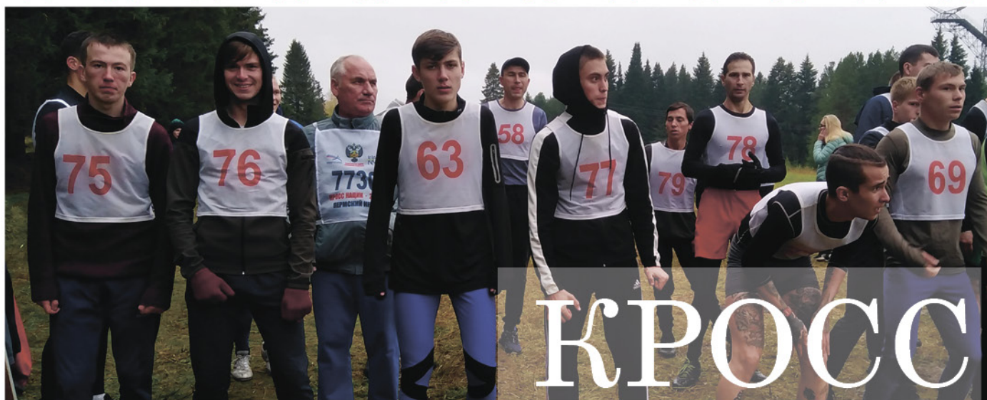
На фото: Команда КПТТ