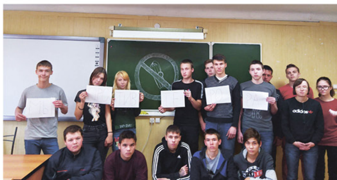
На фото: Группа III-26