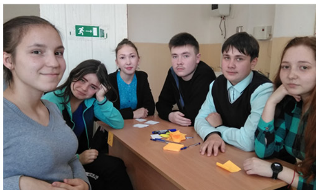
На фото: Команда 101 группы

делили группы СП-111 (политехнический техникум), 108 (педагогический колледж) и ПК-67 (техникум торговли и сервиса).