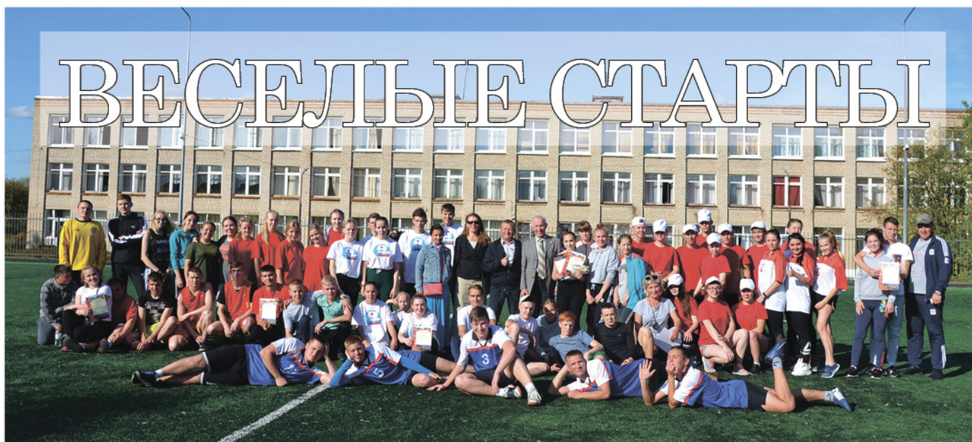
На фото: Команды-участники, жюри, организаторы веселых стартов

11 сентября, на стадионе Кудымкарского педагогического колледжа состоялся спортивный праздник «Веселые старты», посвященные Всероссийскому Дню трезвости.