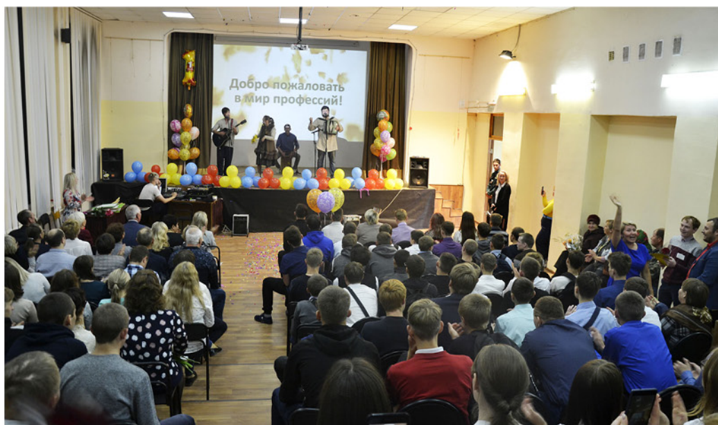
На фото: Выступление группы «Шай-Май»