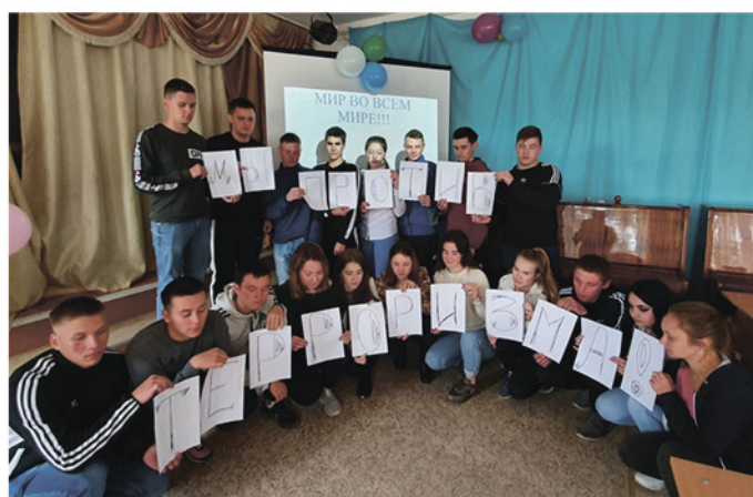
На фото: Группа 408