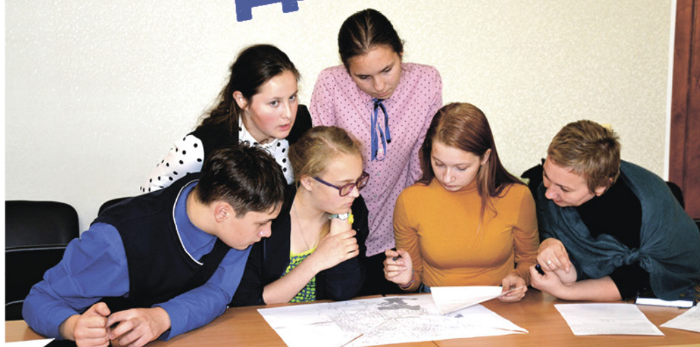
На фото: Участники кружка «Радио и газета «Политех» и клуба «Интеллект XXI века» выполняют первое задание видеоквеста

26 сентября стартовал четвертый этап акции «Видеомарафон «Мы вместе», организованный молодежной избирательной комиссией «Городской округ - город Кудымкар».