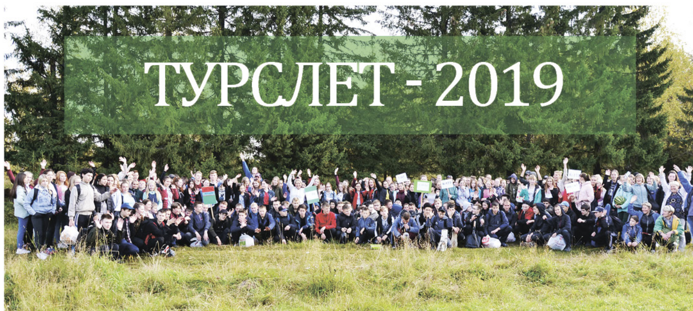
На фото: Участники туристического слета - 2019

13 сентября прошел традиционный туристический слет «Мы вместе» в рамках реализации программы «Адаптация» для обучающихся 1 курсов.