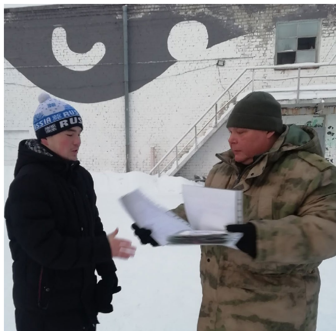
На фото: Вручение грамот