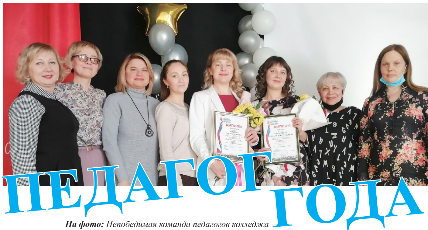
На фото: Непобедимая команда педагогов колледжа

26 февраля завершился зональный этап краевого конкурса «Учитель года - 2021» в номинации «Педагог профессионального образования», который проходил на базе ГБПОУ «Кудымкарский лесотехнический колледж».