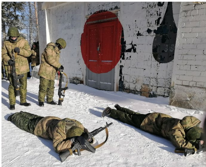
На фото: Военная подготовка на улице