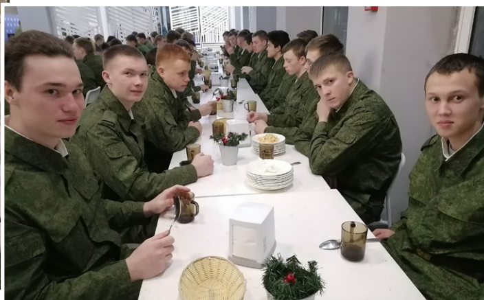
На фото: Обед по расписанию