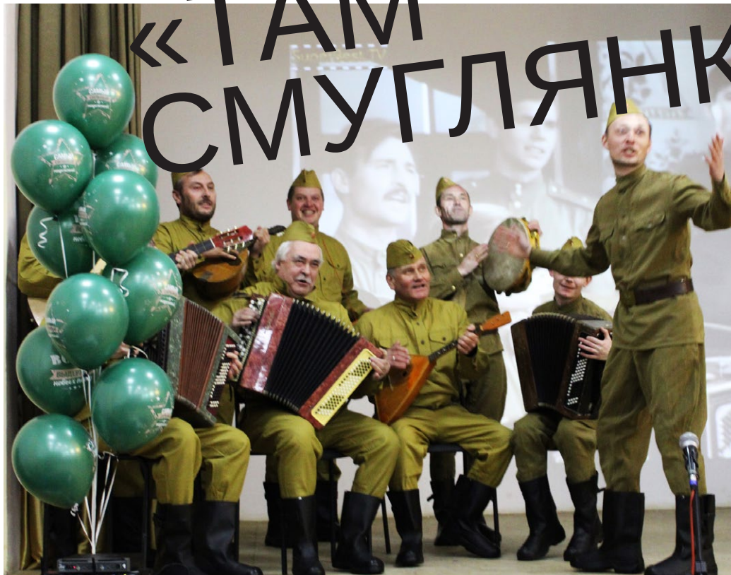
На фото: Мужской коллектив колледжа

19 февраля в колледже состоялся праздничный гала-концерт военно-патриотической песни «О Родине, о доблести, о славе», посвященный Дню защитника Отечества.