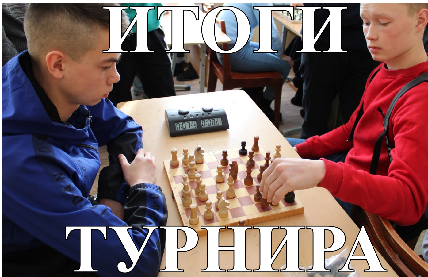
На фото: Турнир по шахматам среди обучающихся колледжа

В феврале прошел турнир по шахматам среди обучающихся колледжа. Подведены итоги игр.