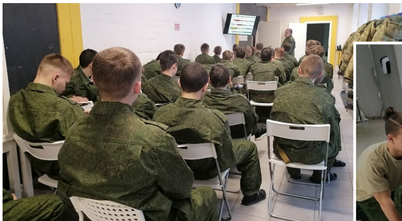
На фото: Теоретические основы военной подготовки