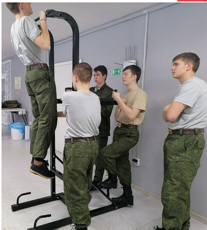
На фото: Проверка физической подготовки