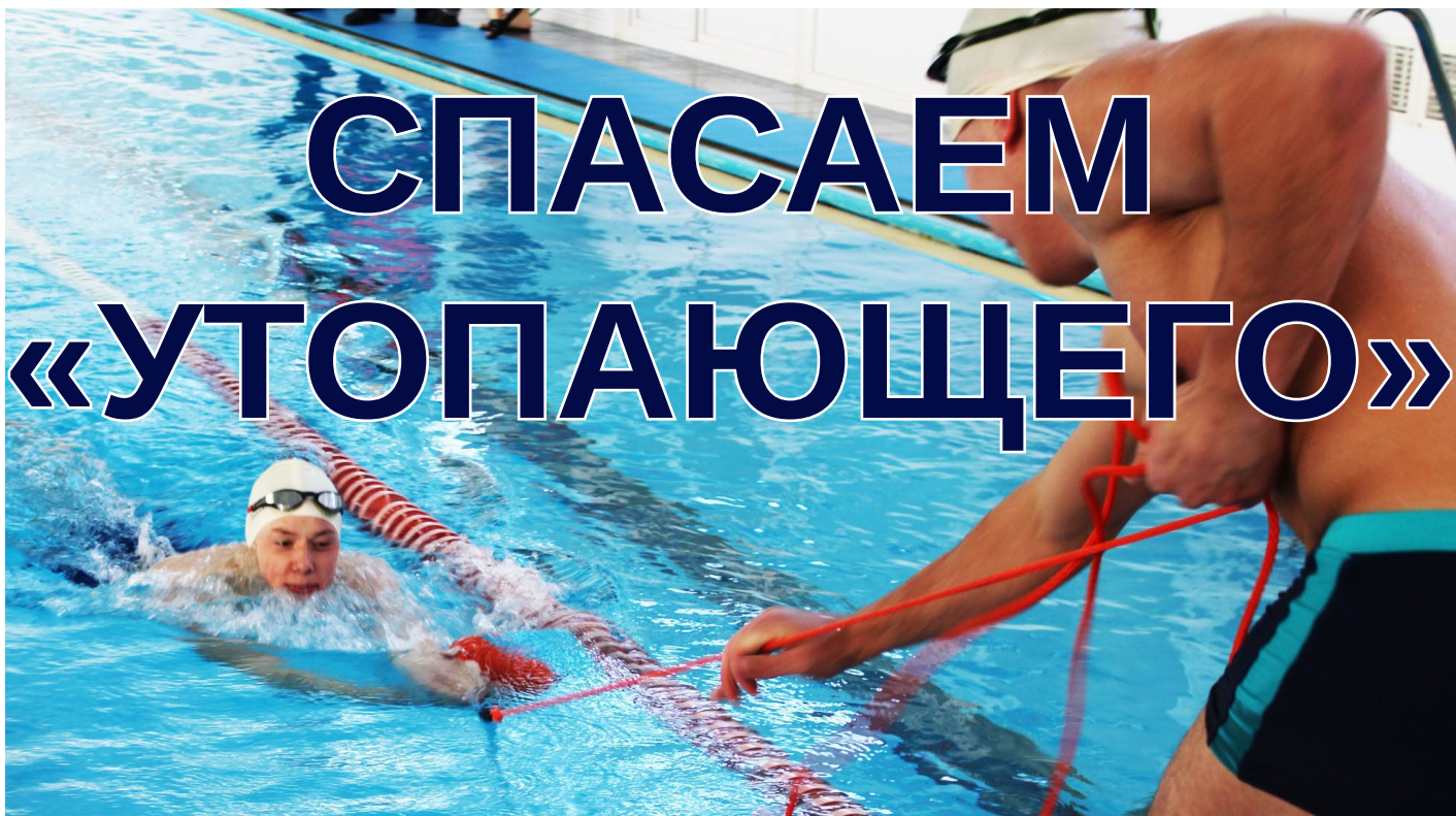
На фото: Студенты КПППК отрабатывают этап «Спасательный конец Александрова»

27 февраля в Кудымкарском плавательном бассейне прошли учения по спасению на воде среди обучающихся профессиональных образовательных учреждений города, приуроченные ко Дню спасателя, 30-летию МЧС России, Дню Защитника Отечества.