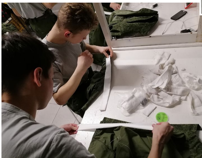
На фото: Юноши учатся пришивать белый подворотничок