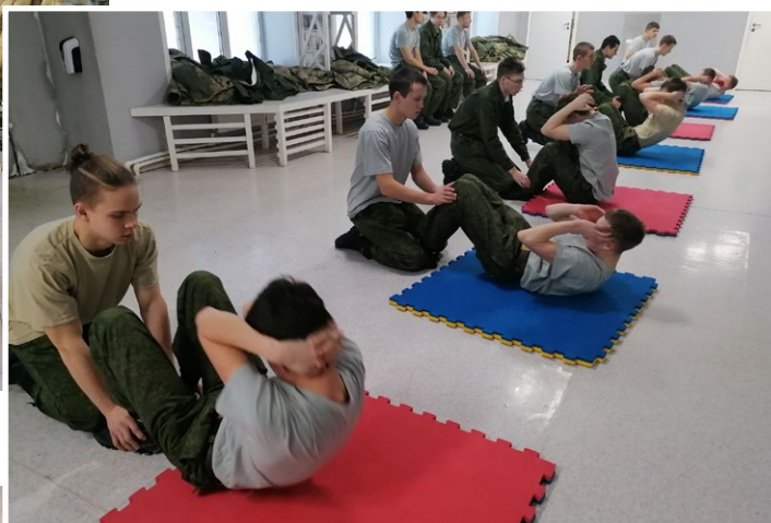
На фото: Проверка физической подготовки