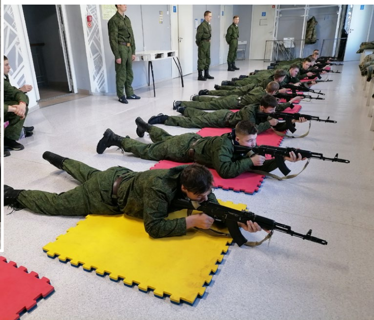
На фото: Подготовка к стрельбе